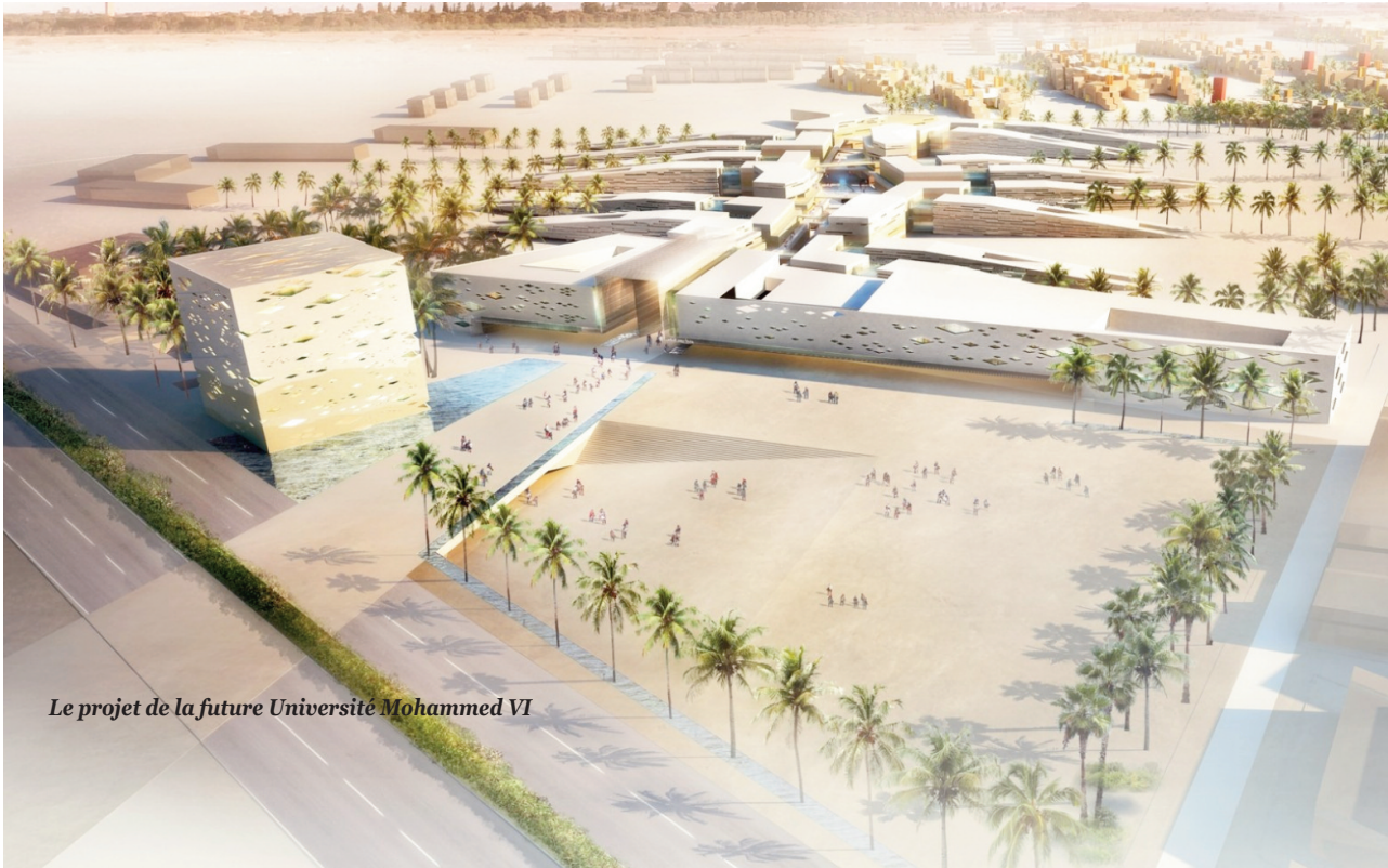
Le projet de la future Université Mohammed VI

Mines de Paris, HEC Paris et le MIT aux États-Unis, en plus du partenariat avec le ministère de l'Enseignement supérieur et de la recherche scientifique. L'Université Mohammed VI Polytechnique constituera un véritable ascenseur social pour les jeunes marocains ou étrangers. Elle permettra, en effet, aux étudiants les plus méritants issus de milieux défavorisés de bénéficier de bourses d'études et d'accéder ainsi aux cycles de formation de leur choix.