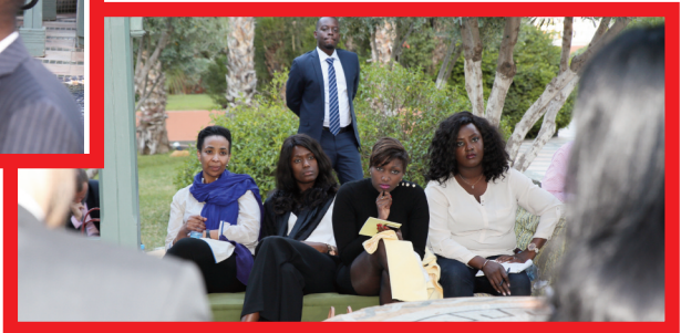
Les Business Meetings du Choiseul 100 Africa

plus haut sommet du monde et s'engager dans le monde associatif. Ce grand sportif a encouragé son auditoire à s'impliquer davantage dans la société civile afin de véhiculer un message positif, de partager leur expérience et de prendre conscience de leur rôle de modèle notamment pour les jeunes générations.