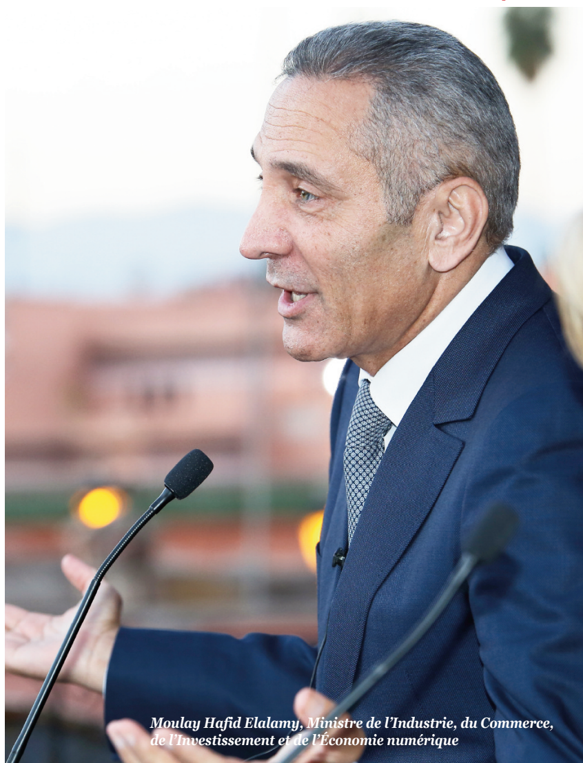
Moulay Hafid Elalamy, Ministre de l'Industrie, du Commerce, de l'Investissement et de l'Économie numérique

Diverses personnalités du monde politique et économique ont tenu à rencontrer les lauréats du Choiseul 100 Africa, soulignant